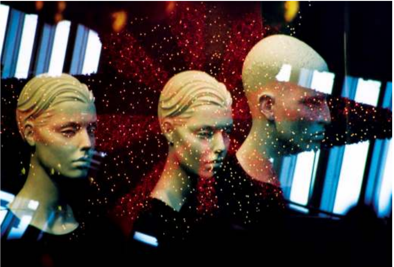
Individualität spielt bei Achim Koefers Modellen keine Rolle, sondern das Drumherum bestimmt das Bild.