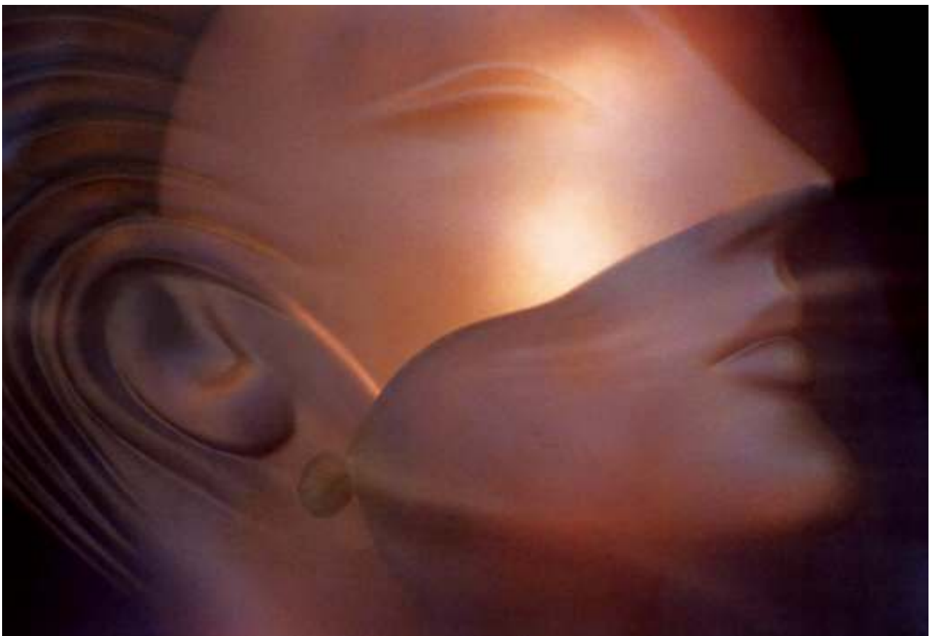
Geheimnisvolle Schönheit, die kaum mehr etwas mit lebenden Wesen zu tun hat.